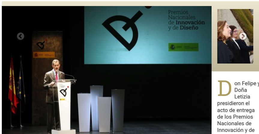
SU MAJESTAD EL REY DURANTE SU INTERVENCIÓN EN LA ENTREGA DE LOS PREMIOS NACIONALES DE INNOVACIÓN Y DE DISEÑO 2017